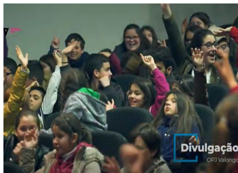
Presupuesto Participativo Joven de Valongo