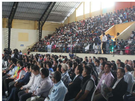
Presupuesto Participativo Parroquial Rural de Imbabura