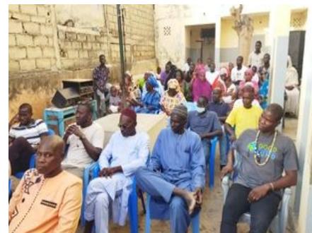
Presupuesto participativo para la discapacidad en Pikine Nord