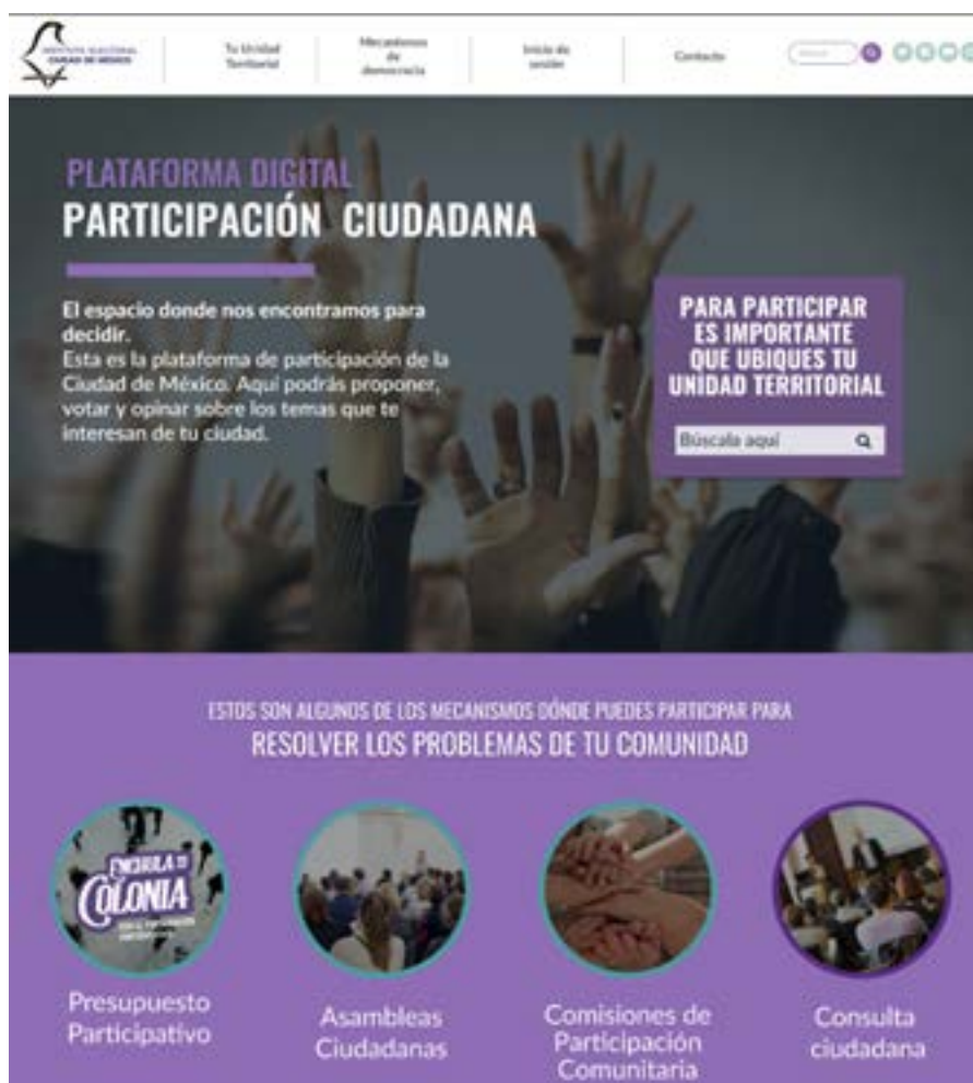
Imagen 2. Reingeniería de la Plataforma de Participación Ciudadana