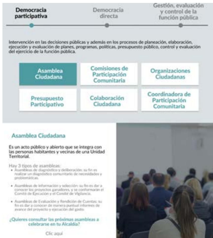
Imagen 3. Navegación en la Plataforma por tipos de democracia