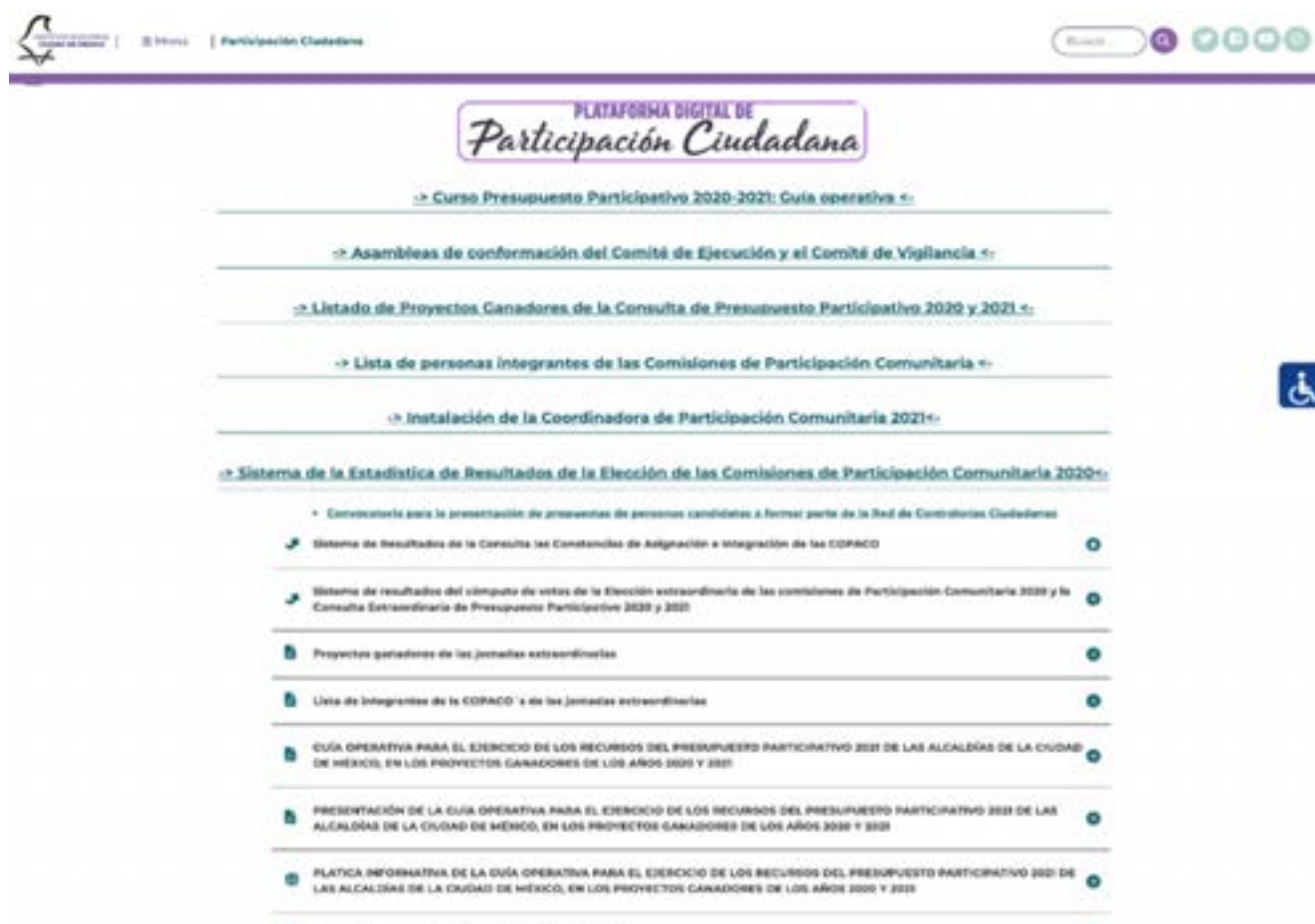
Imagen 1. Primera Plataforma Digital de Participación Ciudadana

A partir de un estudio crítico de la Ley de Participación, se concluyó que la ciudadanía posee más oportunidades de injerencia para mejorar su entorno social y colaborar en comunidad con cuatro mecanismos: COPACO, Presupuesto Participativo, Consulta Ciudadana y Asambleas Ciudadanas. Si bien la Plataforma orientará a la ciudadanía para acceder a cualquiera de los