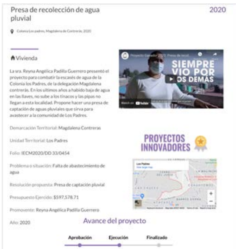
Imagen 4. Presupuesto Participativo