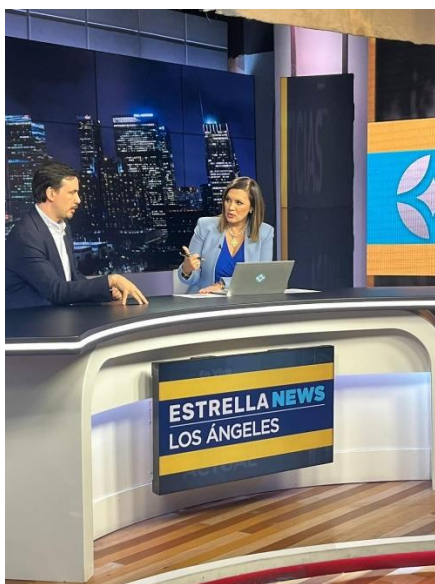
Entrevista con "Estrella News Los Ángeles"