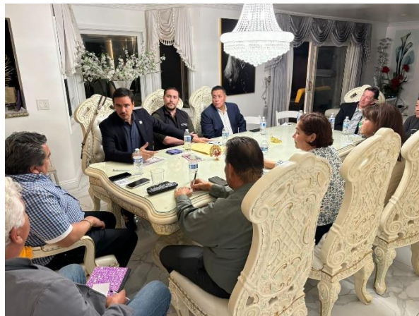
Reunión con comunidades migrantes en Santa Ana