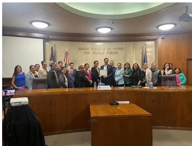
Reunión con comunidades migrantes y autoridades en Huntington Park