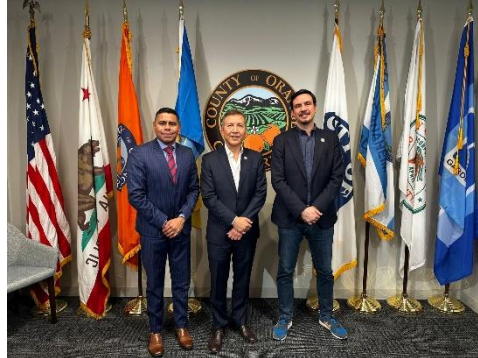
Reunión con autoridades del Condado de Orange