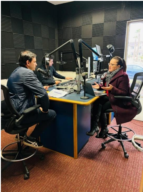
Entrevista con medios Locales de Las Vegas