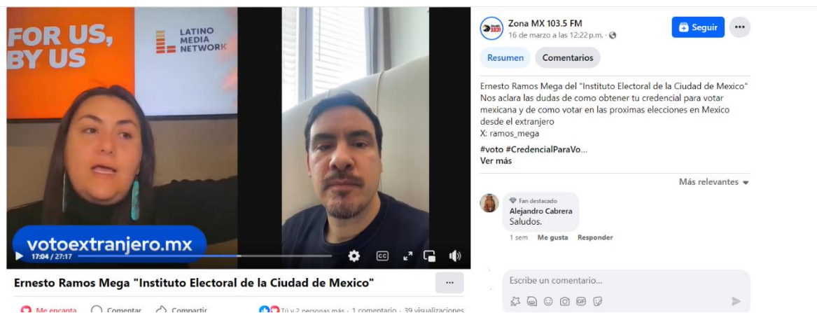
Entrevista con Zona MX 103.5 FM