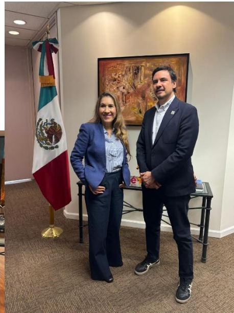
Reunión en el Consulado de Los Ángeles