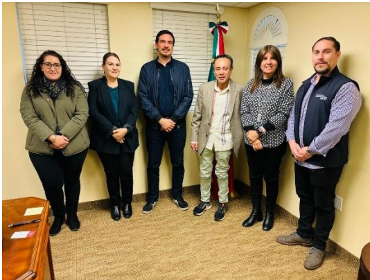
Reunión con autoridades y comunidad migrante en el Consulado de México en Las Vegas