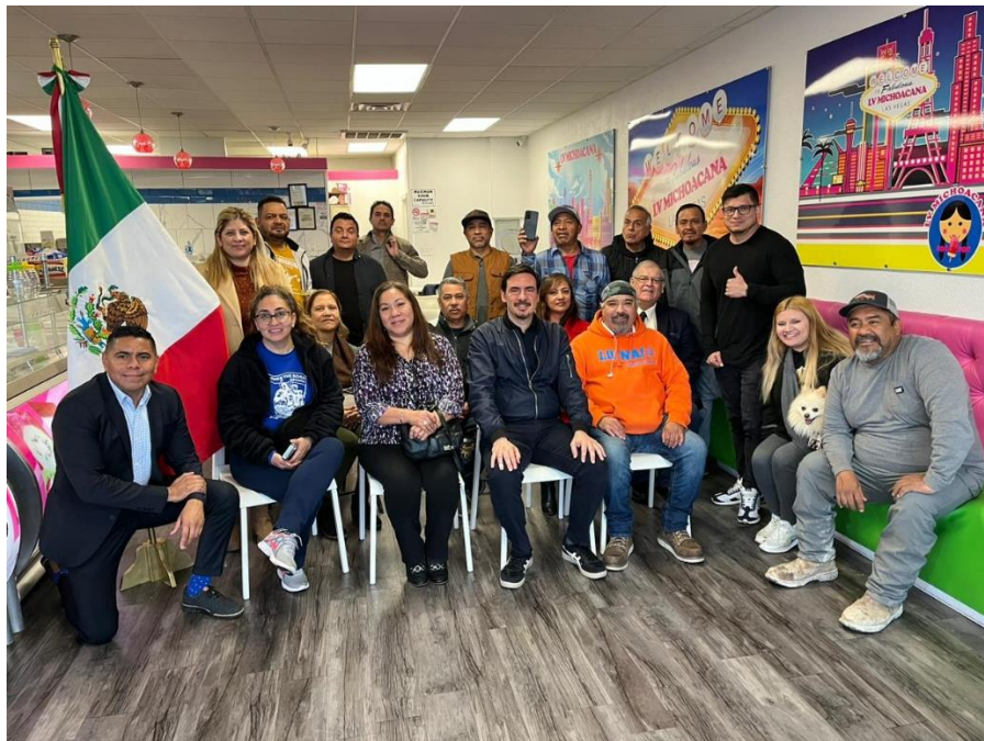
Foro con comunidad Migrante en Las Vegas en Best Paletas In Vegas "LV Michoacana"